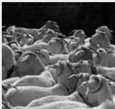
Texto de la portada: Begoña Panea Doblado

Información Técnica Económica Agraria publica anualmente cuatro números por volumen. El precio de la suscripción para 2012 será de 39 €. Se acepta el intercambio con otras revistas. ITEA. Avda. Montañana, 930, 50059 Zaragoza (ESPAÑA). E-mail: jmoreno@aragon.es