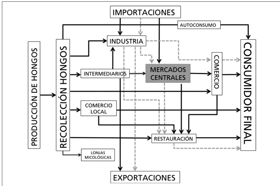
Figura 1. Esquema teórico de la cadena de valor de los hongos silvestres. Líneas de color negro: flujos de hongos en fresco. Líneas discontinuas de color gris: flujos de hongos con algún grado de preparación. Figure 1. Theoretical framework of the wild mushroom chain value. Black lines are for fresh mushrooms trade. Dotted lines are for prepared mushrooms trade.

ocasiones, son los agentes dedicados a comprar las setas a pie de monte y venderlas después a las empresas transformadoras (industria, en la Figura 1) o a los Mercados Centrales de las grandes capitales anteriormente citados. La cadena de valor puede ser más o menos compleja, ya que estos Mercados Centrales también pueden recibir hongos procedentes de otros países. Sin embargo, no existen demasiados trabajos que hayan profundizado en las relaciones existentes entre los distintos eslabones de la cadena. A título de ejemplo, en Secco et al. (2009) se muestran dos ejemplos para las mismas especies ( Boletus sp. ). También en Reyna (2007) se muestra un conciso esquema de lo que podría ser una cadena de valor para la trufa en España.