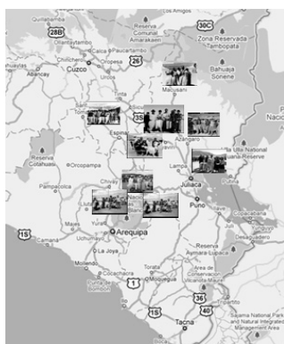
Figura 1. Localización de las zonas muestreadas en Perú